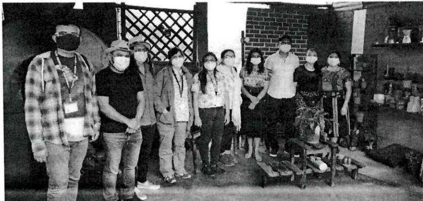
Imagen 6: entrevista con portadora, Palín, Escuintla.